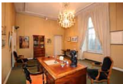
Bureau de Georges Simenon