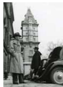
Georges Simenon devant le 36, quai des Orfèvres en 1951

Première image : une photographie de 1951, représentant Georges Simenon devant le 36 quai des Orfèvres, projette d'emblée le visiteur dans l'ambiance du thème de prédilection de l'écrivain : le policier.