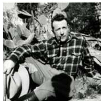
Georges Simenon aux Etats-Unis