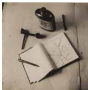
Manuscrit de Pedigree de Marc Simenon