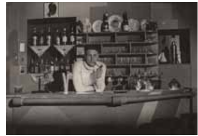
Georges Simenon derrière son bar installé dans son appartement, 21 place des Vosges

Georges Simenon, Histoires du monde malade, 1935