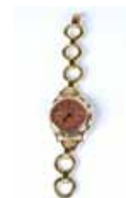
Montre en or ayant appartenu à Georges Simenon