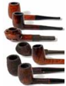
Quelques unes des nombreuses pipes en bruyère de Georges Simenon

Parmi les objets présentés ses objets fétiches, son « Tiki », statuette rapportée d'Afrique et sa boule d'or, son chapeau, sa pipe.