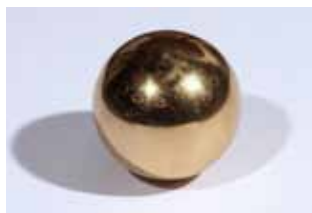
Boule en or

Rédigé en 7 jours en 1957, en Suisse, ce roman fait l'objet d'une prépublication dans La revue des deux mondes en 1958. Il est ensuite édité quatre fois en français, deux fois en allemand et deux fois en langue anglaise. Le 1 er mars 1961, une adaptation cinématographique réalisée par Henri Verneuil sort sur les écrans. Jean Gabin en est l'acteur principal.