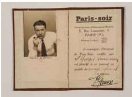
Carte d'envoyé spécial pour Paris-Soir

Simenon part ensuite pour une série de voyages autour du monde. Grand reporter pour différents magazines, il emporte toujours sa machine à écrire et son appareil photo. Ecrivain dans des conditions souvent rocambolesques, il décrit la vie des hommes aux quatre coins de la planète.