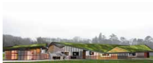
Historial de la Vendée. Les Lucs-sur-Boulogne (85) Musée de France