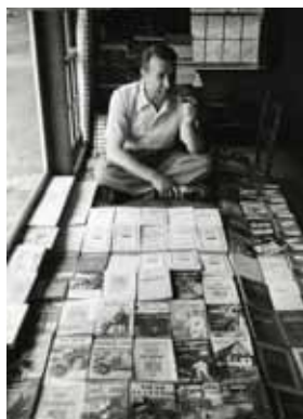
Georges Simenon devant une infime partie de ses romans

Georges Simenon, Entretien avec Roger Stéphane, 1963