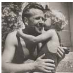
Georges Simenon et son fils Marc au château de Terre-Neuve à Fontenay-le-Comte (85) en 1941

Parmi les objets : une table de bridge, un vélo « Origan » du type de celui que Simenon avait échangé contre des romans à Fontenay le Comte, un hachoir à tabac de guerre, fabriqué et prêté par un artisan local, une machine à écrire « ROYAL KHM ».