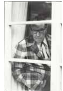
Georges Simenon à la fenêtre de « la maison rose », rue des Figuliers à Lausanne

Parmi les documents présentés, les portraits de Simenon par Cocteau, Vlamincq et Buffet.